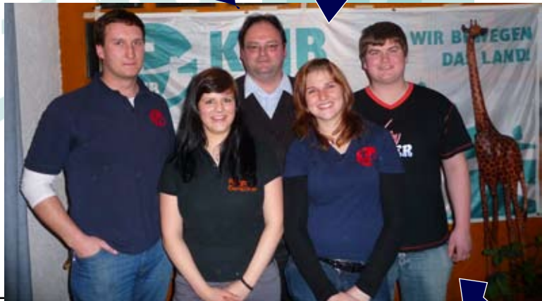
die neue Vorstandschaft