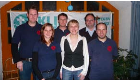
die ehemalige Vorstandschaft