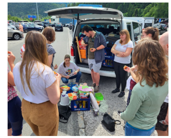
Woche für Verantwortliche in der Jugendarbeit